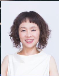
© Ayane Shindo ピアノ 小柳 美奈子