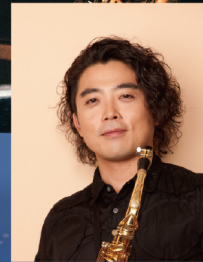
© Natsuki KAREN サクソフォン 福井 健太