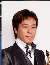
© Natsuki KAREN サクソフォン 山田 忠臣