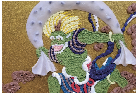
1.《Story I Where am I.....?》2012年 2.《Cream Painting -神奈川沖波-》2021年 3.《雷神-マカロン-》2020年 4.《風神-大福-》2020年 5.《I'm thinking》2014年