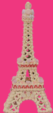
《Sweet Eiffel Tower》2012年

※2度目はオトク！リピーター割引 半券提示で前売料金で観覧いただけます(大人のみ)